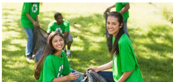
El sistema de participación juvenil garantiza más espacios de participación política y social para los jóvenes.